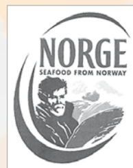
Norsk varemerkeregistrering 203708 – Eksport- utvalget for fisk

CURO kan gjennomføre forundersøkelser og vurderinger, lage forslag til vare- og tjenestefortegnelser, være ansvarlig for innlevering og bearbeidelse av søknader og assistere i konflikter.