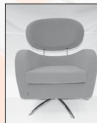
Norsk designregistrering 81088 – Brunstad AS